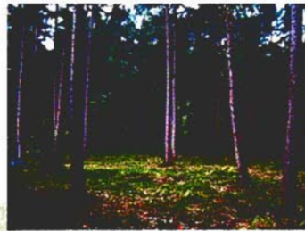
手入れされた森(間伐後)