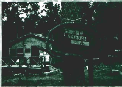
「トラストの森」とウヨロ小屋

「トラストの森」は、ウヨロ川周辺の自然環境保全の拠点として、2001年に有志が資金を拠出して取得したカラマツ林です。カラマツは約40年前に植えられ、その後放置されていましたが、現在は手入れが進み明るい森に変わりつつあります。トラストの森の中にはウヨロ小屋という山小屋があります。小屋の柱や壁、テラスの材料はトラストの森の手入れで伐った間伐材が使われています。