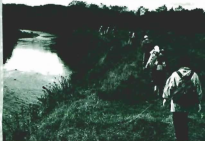
ウヨロ川とフットパス

「トラストの森」は、ウヨロ川周辺の自然環境保全の拠点として、2001年に有志が資金を拠出して取得したカラマツ林です。カラマツは約40年前に植えられ、その後放置されていましたが、現在は手入れが進み明るい森に変わりつつあります。トラストの森の中にはウヨロ小屋という山小屋があります。小屋の柱や壁、テラスの材料はトラストの森の手入れで伐った間伐材が使われています。