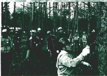
環境ボランティア活動の様子(枝打ち)

ウヨロ川は、胆振支庁管内の最高峰ポロホロ山(標高1,322m)を水源とし太平洋に注ぐ、水質良好な流路延長18.8km、流域面積61.2km 2 の二級河川です。1965年から70年にかけてショートカットを中心とする河川改修が行われ、下流部の左岸には自然豊かな三日月湖が何箇所も残されています。中流部の左岸を中心に川沿いにはフットパス(自然歩道)が整備されており、秋には間近にサケの遡上と産卵の様子が観察できます。